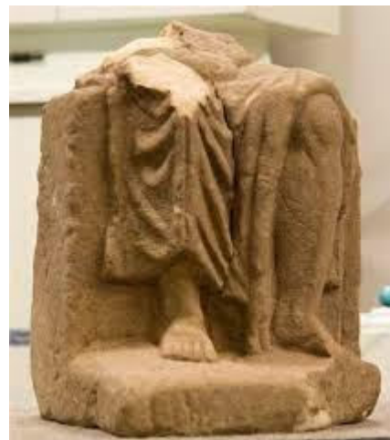
Foto: Beeldfragment van een tronende Jupiter te zien in het Roerstreek museum

Vermoedelijk heeft op een sokkel midden in 'Medericum' een beeld van de oppergod Jupiter - zittende op een troon - gestaan.