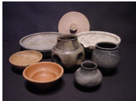
Foto: Romeinse vondsten (drinkbekers, kommen, borden, wrijfschaal en deksel) uit het grafveld aan de Akerstraat.

De Romeinen cremeerden veelal hun doden en begroeven de resten dan in de grond. Ook gaven ze hun doden vaak geschenken mee. Die grafvelden vinden we vaak langs een weg. Langs de Via Traiana zijn op verschillende plekken grafvondsten gedaan, zoals in Echt, Posterholt, Melick en Swalmen.